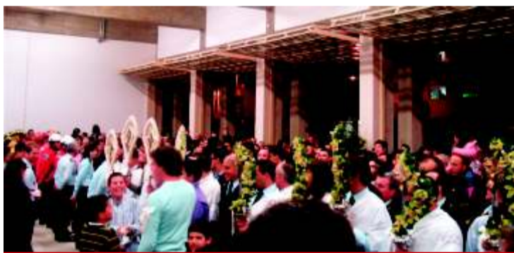
Encontro das Cruzeiros de Barbudo e Vila Verde: uma velha e sempre respeitada tradição.