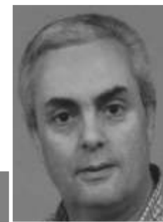
por Alberto Nídio

Gostamos de ouvir o senhor padre Rui Tereso