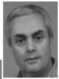
por Alberto Nídio

Se ao que atrás fica dito juntarmos a sempre pronta disponibilidade do Intermarché para nos abrir o seu espaço a campanhas de sensibilização e rastreios sanitários, fica definitivamente pintado um quadro que gostosamente aqui reproduzimos, para que todos admirem e, como muito esperamos, copiem e ponham ao serviço da nossa nobre causa, que, desse modo, de todos os que a nós