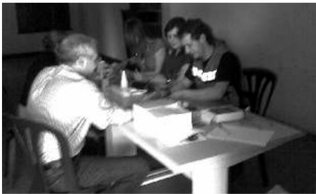
Presidente da Câmara Municipal de Vila Verde participou neste rastreio