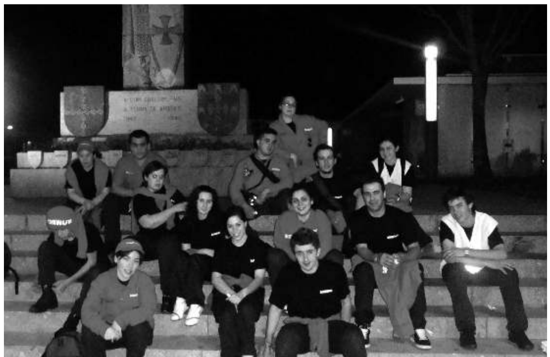
Grupo de estagiários, no monumento a Gualdim Pais, em Amares, no caminho para S. Bento.

Os estagiários que cumpriram a formação de técnicas de socorrismo deslocaram-se à Abadia de S. Bento a pé para cumprirem uma promessa, que fizeram com o decorrer do curso. Nesta iniciativa, contaram com a colaboração do comando, sendo motivo para que o pároco na homilia dominical chamasse a atenção para a presença dos bombeiros na mesma, louvando a sua atitude.