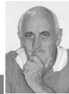
por Augusto Faria

e estas só não são mais evidenciadas, porque a humildade e a capacidade de improvisação dominam os bombeiros da nossa