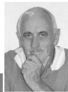
por Augusto Faria

A Direcção da Associação, entendeu, que era o momento importante, visto comemorar-se por todo o país o Ano do Voluntariado nos Bombeiros, numa altura em que a população deste