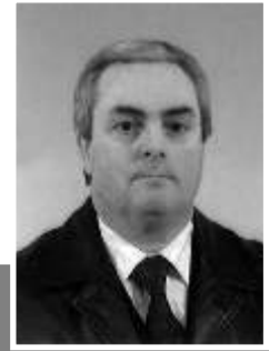
por Alberto Nídio

O Bombeiro tinha liberdade de acção quando era chamado para socorrer aqueles que dele necessitavam porque não havia entraves do patrão.